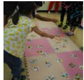
ワークショップの様子 カルタづくり(左)・カルタつり(右)

図書館は、ただあればいいわけではない。そこに多くの人に関わってお互いを育て合うことが大切であることを、私は静岡での経験を通して教えてもらいました。この度、スギヤマカナヨさんが静岡市立図書館と静岡図書館友の会共催の「しずとしょフェスタ」でお話なさると伺いました。図書館を思う人々のつながりが、また一つ増えることが大変うれしいです。